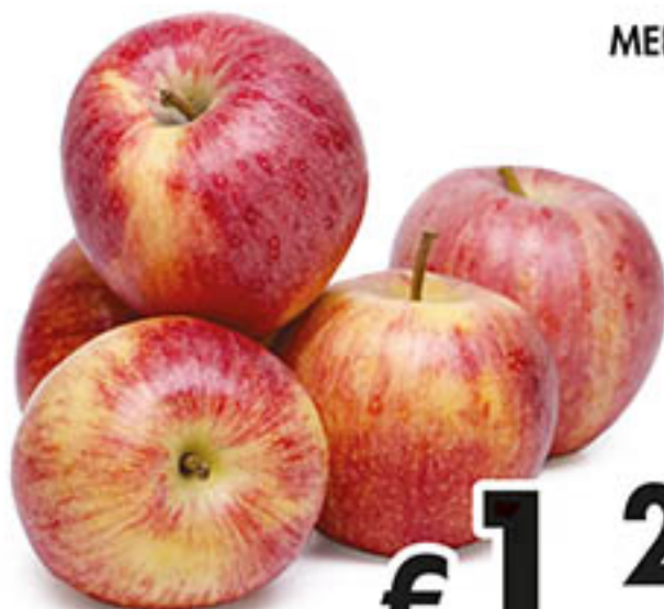
MELE FUJI al kg