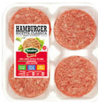
HAMBURGER DI TACCHINO AMADORI x 4 g 410 al kg € 9,73