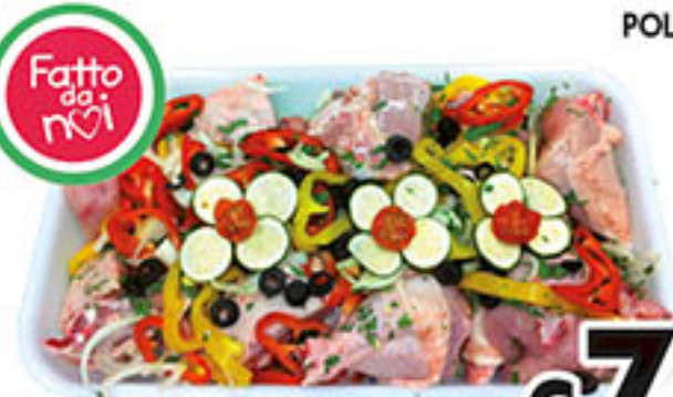
POLLO A PEZZI CONDITO al kg