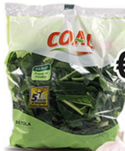
BIETOLA COAL g 500 al kg € 2,78