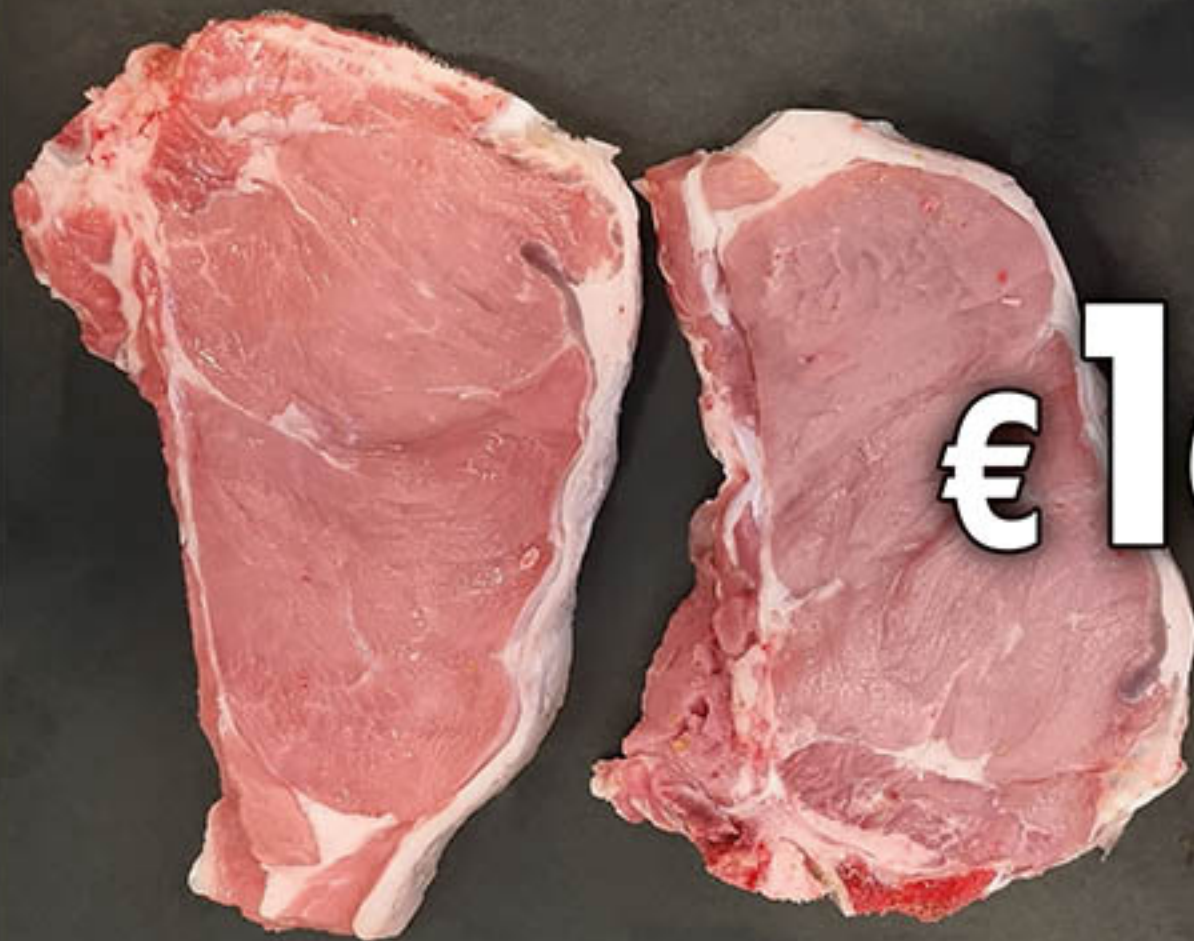
LOMBATINE DI VITELLO al kg