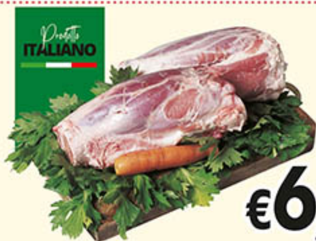
STINCO DI SUINO al kg