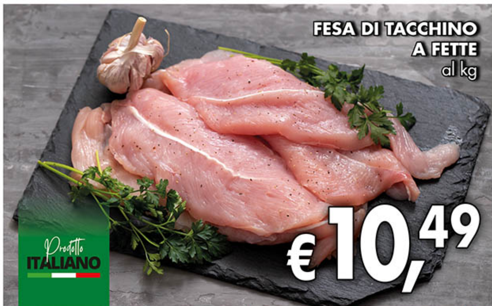
FESA DI TACCHINO A FETTE al kg