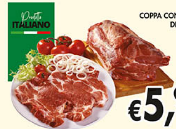
COPPA CON OSSO DI SUINO al kg