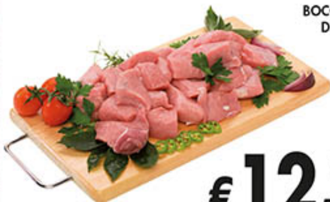
BOCCONCINI DI VITELLO al kg