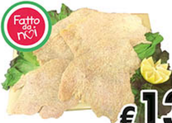
COTOLETTE DI TACCHINO PANATE al kg