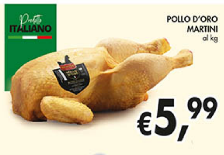
POLLO D'ORO MARTINI al kg