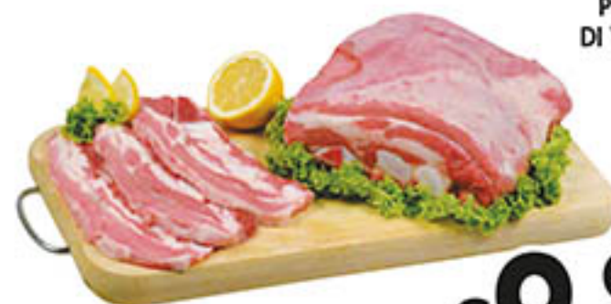
PUNTINE DI VITELLO al kg