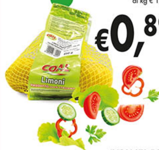
LIMONI PRIMO FIORE COAL g 500 al kg € 1,78