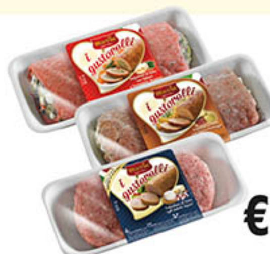
GUSTOROLI MARTINI g 650 al kg € 9,22