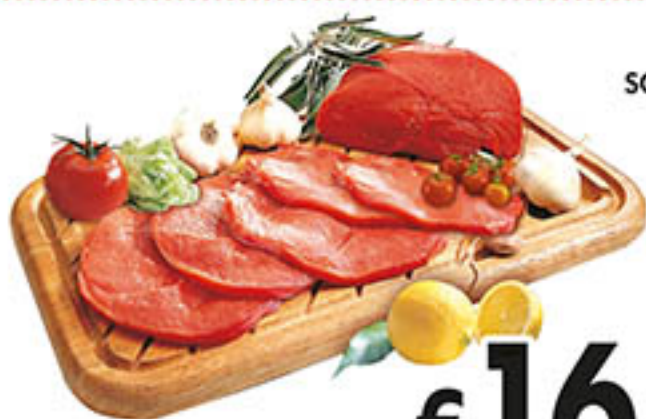
FETTINE SCELTISSIME al kg