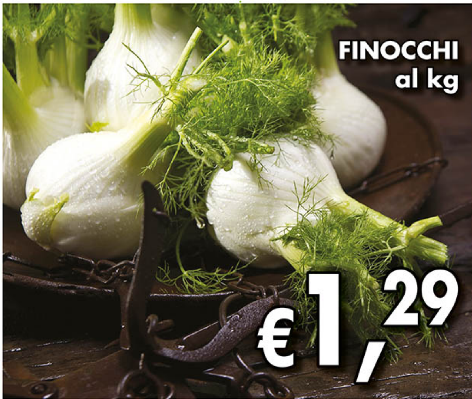
FINOCCHI al kg