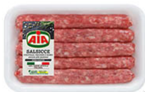
LUGANEGA CON POLLO E TACCHINO AIA g 450 al kg € 8,87