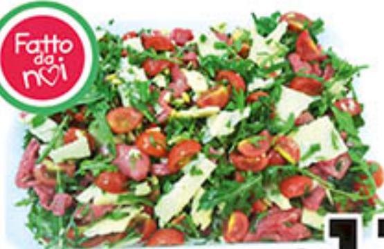
STRACCETTI DI VITELLO al kg