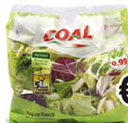
INSALATA POKER CON FINOCCHIO COAL g 200 al kg € 4,45